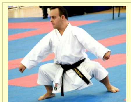
Capacidades Diferentes En la Competencia de Karate

1.5.1. Las federaciones por intermedio de sus presidentes y/o de delegados, podrán realizar una protesta oficial escrita, si es que observan algunas irregularidades, en algún apartado de este reglamento, y en la preinscripción de lo/as Atletas. Se le descontaran puntos al imputado 1,0 a 3,0.