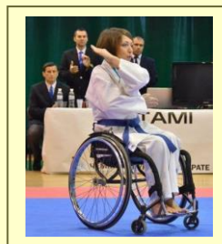
KARATE – ADAPTADO (o Capacidades Diferentes)

Los Réferis y Jueces evaluarán por puntaje durante el Kata al Competidor/a, en la realización de la ronda clasificatoria la limitación que el mismo atleta tenga para su desempeño causado por el deterioro, dicho panel de arbitraje dará entre 01 y 03 puntos extra decimal, de acuerdo al caso (de 0,0 a 0,3), esta diferencia se agregará al puntaje que los oficiales estimen para el desarrollo establecido.